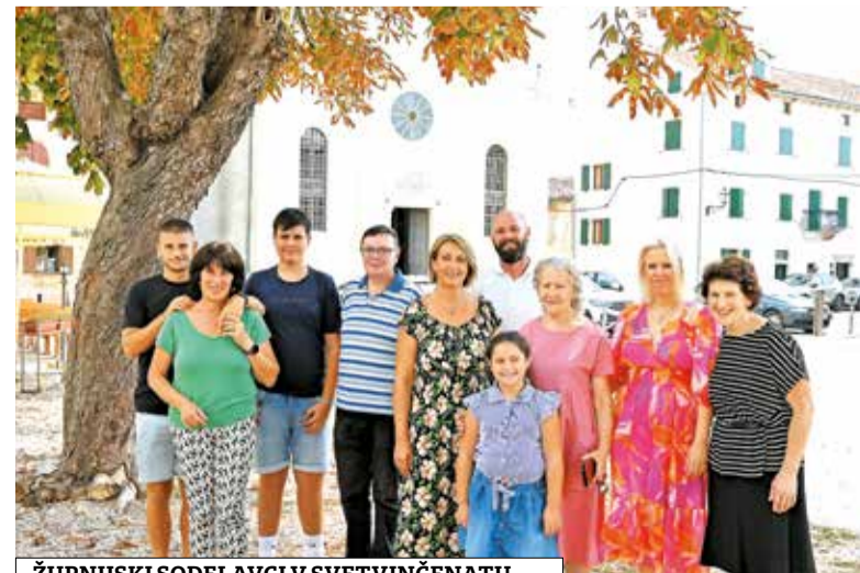
ŽUPNIJSKI SODELAVCI V SVETVINČENATU

Skrbela sem za taščo, in ko je gospa, ki je skrbela za krašenje s cvetjem v cerkvi, pred šestimi leti zbolela, sem vskočila in ostala. Poskrbela sem za taščo (zdaj za moža) in urejala cvetje, videla pa tudi, da je treba počistiti cerkev, oprati cerkveno perilo. Delam vse, kar je potrebno, da je hiša božja čista in lepa, in bom vztrajala, dokler mi bodo dopuščale moči. V molitvi se rada zatekam k Miroslavu zaradi njegovega zgleda, kako je živel odnos do Boga in Cerkve, da tudi meni izprosi moč, da bom lahko tako živela. Preden je postal blaženi, ga nisem niti poznala. Ko sem se mu potem v čem priporočala, sem glede na razplet lahko videla, da je dejansko posredoval. Lahko se jezim ali reagiram burno, ko pa se spomnim, kako je Miroslav odpustil, ko je daroval življenje, se v molitvi zatečem k njemu in odpuščam, ko se mi kaj zgodi. To mi je v pomoč, da ostajam mirna tudi, ko pridejo napetosti, in se ne jezim, pa tudi sama prosim za odpuščanje, če sem koga prizadela. Zdaj, ko mi je najtežje, govorim z njim osebno ter prejmem moč in mir. Občestvo mi pomaga sprejemati vse, kar življenje prinaša, brez stika z Jezusom pa je res težko. Zahvaljujem se za vse.